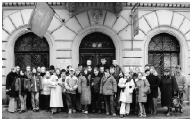
Cieszynianie przed domem Matejki

Bractwo Miłośników Starego Miasta Cieszyna działa od 2000 roku przy Muzeum Śląska Cieszyńskiego w Cieszynie. Obecnie w skład Bractwa wchodzi 23 uczniów cieszyńskich szkół gimnazjalnych i szkół średnich, jego celem jest upowszechnianie wiedzy o historii i tradycji Cieszyna oraz poznanie innych historycznych miast w Polsce. Od początku działa aktywnie, osiągając sukcesy na konkursach organizowanych przy okazji corocznych Ogólnopolskich Zjazdów Bractwa Młodych Miłośników Starych Miast. W tym roku IX Zjazd odbędzie się w Kłodzku, w dniach 27-30.08.2004r. Działalność Bractwa wspiera finansowo Miasto Cieszyn. Regularna działalność nie byłaby możliwa bez społecznego zaangażowania pracowników Muzeum Śląska Cieszyńskiego.