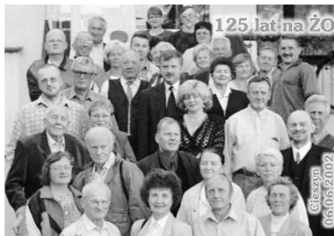
Część uczestników spotkania w dniu 06.06.2002 r. – łącznie 125 lat na żywności Optymalnym

Zapraszamy specjalistów mających coś ciekawego do powiedzenia na temat poprawnego odżywiania i jego oddziaływania na zdrowie.