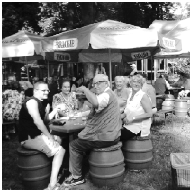
Na pikniku w sierpniu 2003 r.

Jak wspaniale efekty daje ten sposób odżywiania można się przekonać rozmawiając z uczestnikami takich spotkań (w każdy pierwszy czwartek miesiąca). Nie tylko z prelegentami, ale i ze słuchaczami wyleczonymi tą metodą z cukrzycy, miażdżycy, choroby Burgera, astmy, alergii, gościca, zwyrodnień stawów czy nawet nowotworów. Na załączonych zdjęciach wiele osób to właśnie takie żywe przypadki „cudów”.