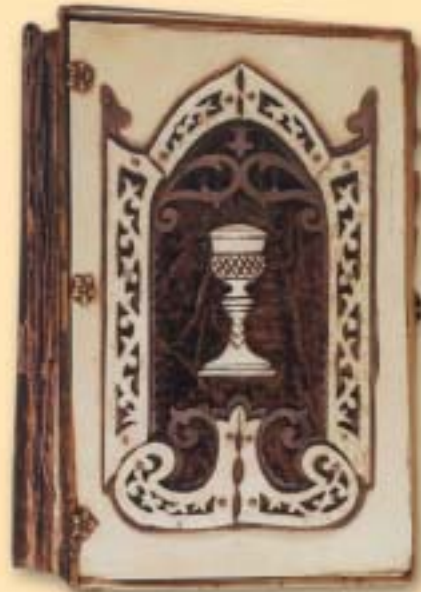
"Kancjonał czyli śpiewnik dla chrześcijan" Cieszyn 1897 r.