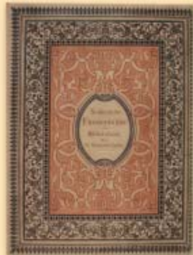
"Schlesische Fürstenbilder des Mittelalters" 1872 r. (Wyobrażenia książąt śląskich w średniowieczu)