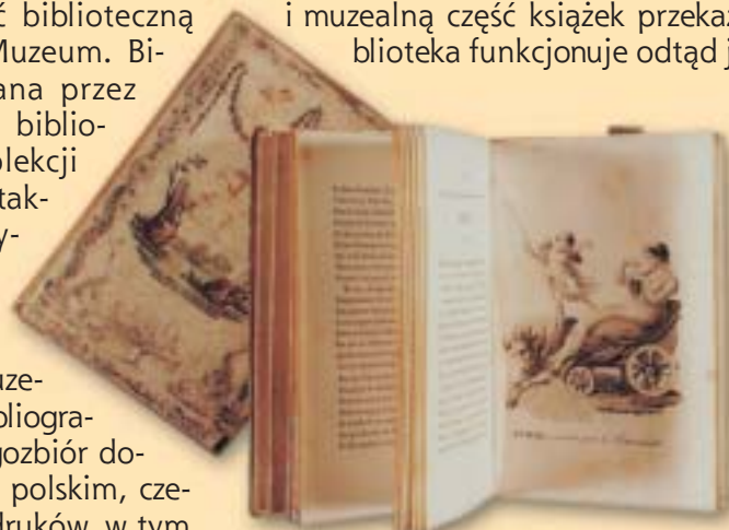
"Les Mois" - Poetycki opis miesięcy i pór roku (w jęz. francuskim) 12 oryginalnych rycin, II poł. XIX w.