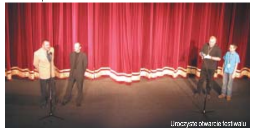
Uroczyste otwarcie festiwalu