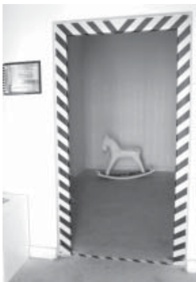
Wystawa w galerii „Szara”