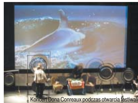
Koncert Dona Conreaux podczas otwarcia festiwalu