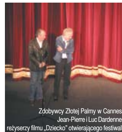
Zdobywcy Złotej Palmy w Cannes Jean-Pierre i Luc Dardenne reżyserzy filmu „Dziecko” otwierającego festiwal