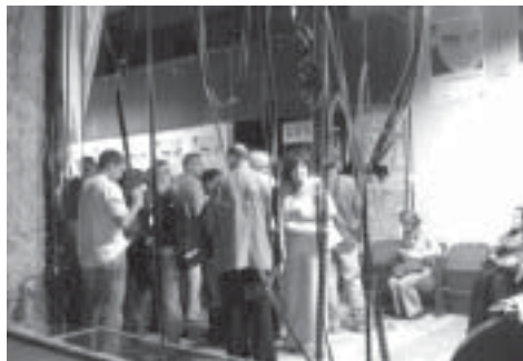
Pod Brunatnym Jeleniem