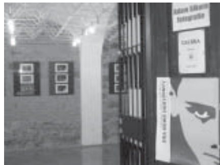
Wystawa w „Domu Narodowym”