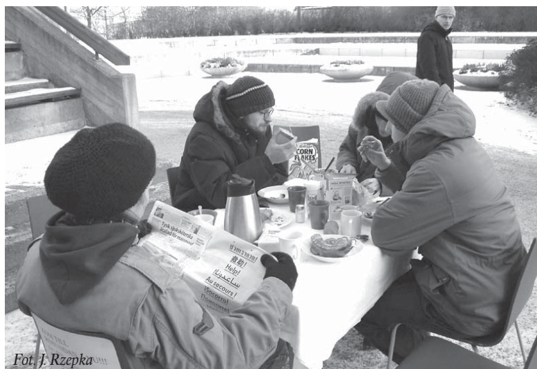
Performance – „Nie rozmawiaj przy jedzeniu”