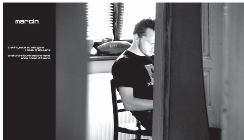
Praca Grupy Pozitywnej – „Pary/Przyjaciele/Przedmioty”