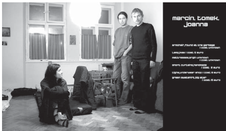
Praca Grupy Pozitywnej – „Pary/Przyjaciele/Przedmioty”