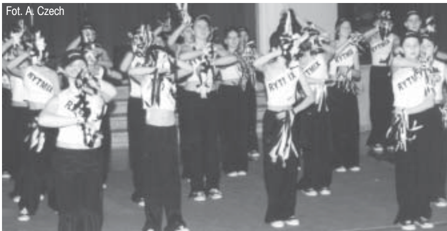
Zespół taneczny „Rytmix” ze Szkoły Podstawowej nr 2 w Brennej