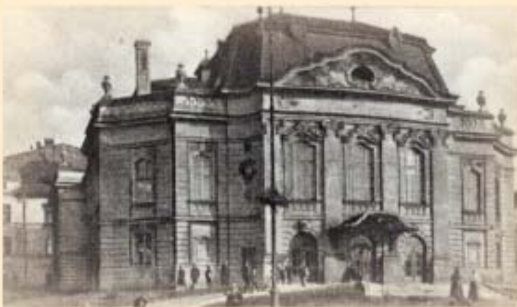
Widok Teatru z lat trzydziestych XX w.

Zapraszamy Czytelników do współredagowania tej strony. Prosimy o nadsyłanie ciekawostek związanych z Cieszynem (np. anegdot, przepisów kulinarnych, zdjęć, dokumentów, wzorów rękodzieła artystycznego itp.), które mogłyby zainteresować innych i wzbogacić wiedzę o naszym mieście. Gwarantujemy zwrot wszystkich otrzymanych materiałów.