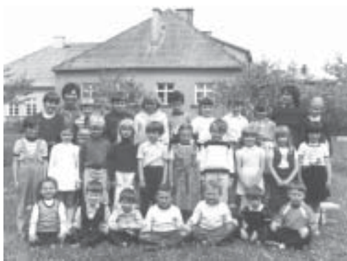
Zdjęcie z 1984 r.