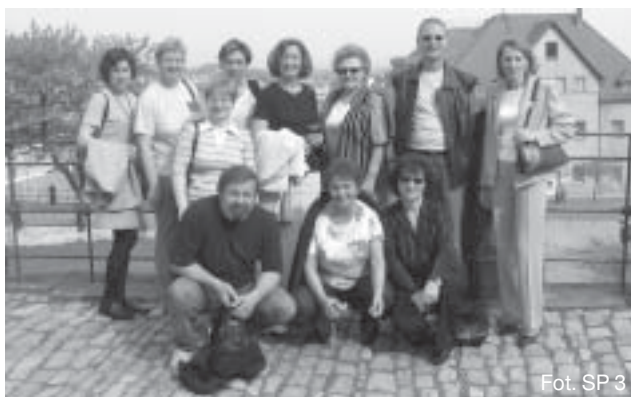
Fot. SP 3