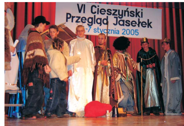
Dom Dziecka z Kończyc Wielkich