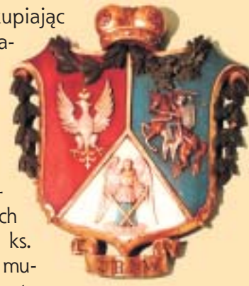
Herb Polski, Litwy i Rusi pierwotnie z napisem „Boże zbaw Polskę”, 2 poł. XIX w.

Wiadomości Ratuszowe, Biuro Promocji i Informacji, Rynek 1, 43-400 Cieszyn, e-mail: wr@um.cieszyn.pl