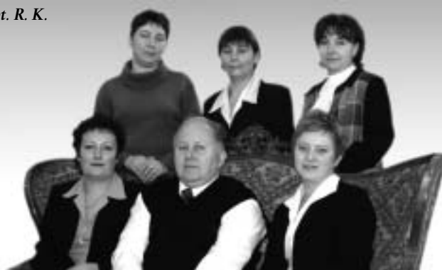
Pracownicy Wydziału Spraw Obywatelskich