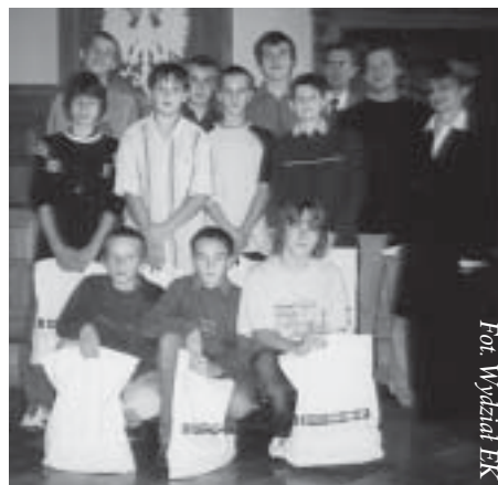
For. Wydział EK

W dniu 30 września br. Rada Miejska obradowała na swojej kolejnej sesji zwyczajnej. Rozpoczął ją miły akcent – gratulacje dla drużyny chłopców z Gimnazjum nr 2 w Cieszynie, która zdobyła w minionym sezonie mistrzostwo Śląska w koszykówce, połączone z wręczeniem symbolicznych upominków – piłek do koszykówki.