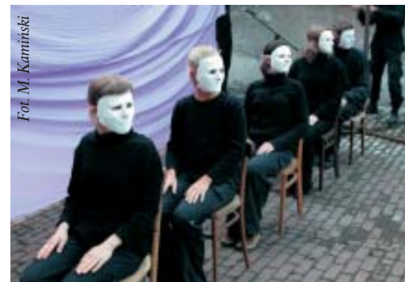
Występ Komuny Otwock