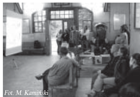
Fot. M. Kamiński