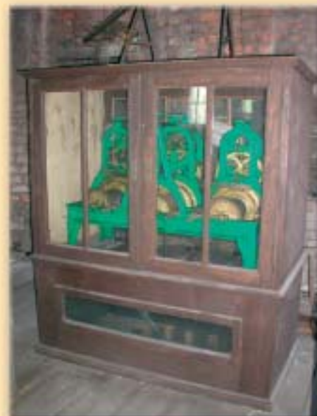
Mechanizm zegara z Wieży Piastowskiej