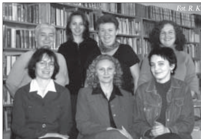
Pracownicy Czytelni i Wypożyczalni

Czytelnia i Wypożyczalnia to, obok Oddziału dla Dzieci, miejsca bezpośrednio związane z czytelnikiem. To właśnie tutaj trafia uczeń poszukujący „Pana Tadeusza”, student podręcznika do pedagogiki, pracownik kodeksu pracy czy emeryt poszukujący ciekawej powieści. Chęć zaspokojenia potrzeb wszystkich naszych czytelników przesądza o uniwersalnym charakterze zbiorów Czytelni i Wypożyczalni. Gromadzone przez nas książki popularnonaukowe dotyczą wszystkich dziedzin wiedzy. Dążymy do tego, aby w naszych zbiorach reprezentowany był aktualny stan wiedzy z danego zakresu, dlatego wycofujemy książki zdezaktualizowane i w miarę możliwości zakupujemy nowości, głównie z tych dziedzin, które rozwijają i zmieniają się najszybciej. Również dział literatury pięknej jest stale uzupełniany. Kierując się upodobaniami czytelników i ofertą rynku wydawniczego, korzystając m.in. z darów pieniężnych pochodzących od czytelników, wzbogacamy ten dział o nowości. W trosce o naszych czytelników obserwujemy również rynek czasopism. Tak dobieramy tytuły prenumerowanej przez nas prasy, aby każda odwiedzająca nas osoba znalazła coś dla siebie. Obecnie w Czytelni i Wypożyczalni dostępnych jest ponad 80 tytułów czasopism bieżących.