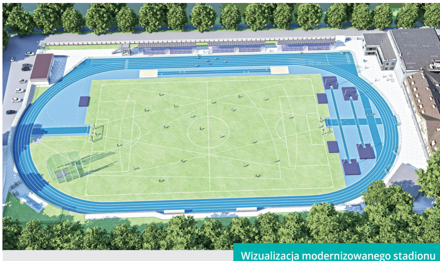
Wizualizacja modernizowanego stadionu

ną. Doskonałym tego przykładem jest oddolna inicjatywa osób spotykających się na sobotnich park runach. Ponadto zmodernizowane obiekty na pewno przyczynią się do podniesienia atrakcyjności turystycznej Cieszyna i istotnie wpłyną na estetykę miejsc, w których są zlokalizowane. Nie ukrywam też, że w przypadku stadionu lekkoatletycznego moim marzeniem jest rozegranie na nim Lekkoatletycznych Mistrzostw Cieszyna i powrót do idei spartakiad osób niepełnosprawnych. Stadion będzie też świetnie służył piłkarzom, a nasi lekkoatleci osiągający wysokie wyniki sportowe będą mogli znaleźć na nim godne miejsce do swoich treningów. Modernizacja stadionu przyczyni się ponadto do zwiększenia atrakcyjności hotelowej części „Gościńca Sportowego” i na pewno będzie miała wpływ na postrzeganie cieszyńskich szkół (podstawowych i ponadgimnazjalnych), które zyskują nową przestrzeń do realizacji zajęć z wychowania fizycznego i rozgrywania zawodów sportowych. Stadion, który wybudujemy będzie spełniał wymagania PZLA i IAAF dla obiektów kategorii VA, co oznacza, że będzie można przeprowadzić na nim Mistrzostwa Polski w wybranych konkurencjach, mitingi ogólnopolskie, zawody okręgowe i lokalne. Wartość tej inwestycji szacowana jest na ponad 7 mln złotych, przy czym planujemy pozyskanie na ten cel blisko dwumilionowej dotacji Ministerstwa Sportu i Turystyki. ◆