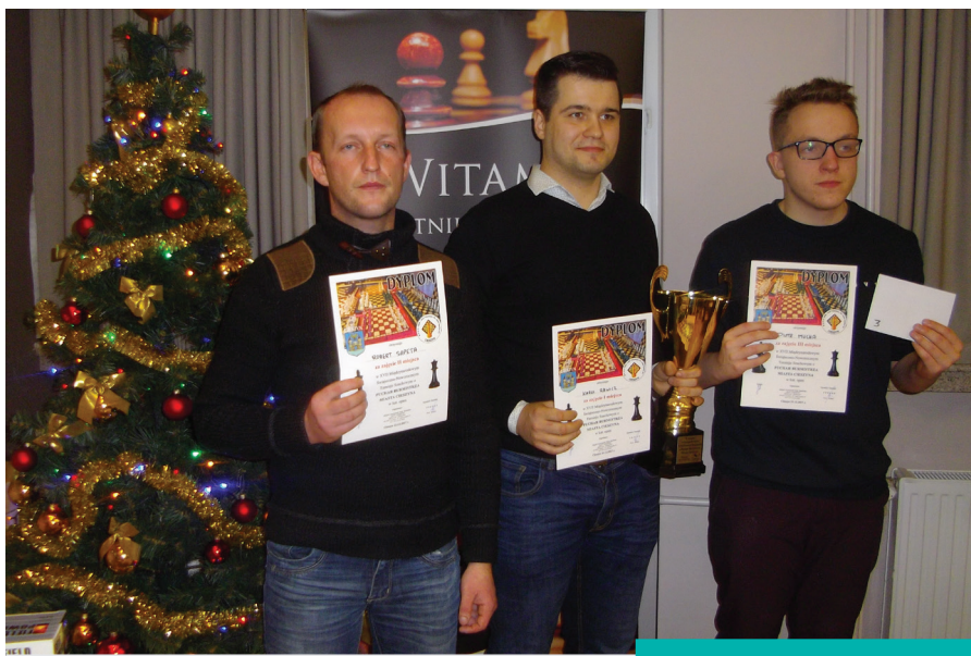
Zycienci szachowych zmagani