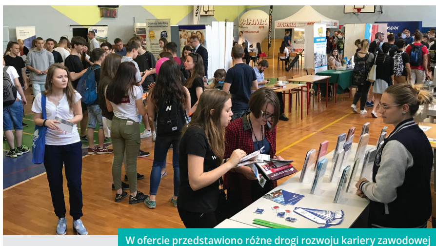
W ofercie przedstawiono różne drogi rozwoju kariery zawodowej