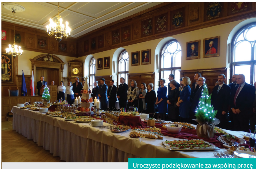
Uroczyste podziękowanie za wspólną pracę