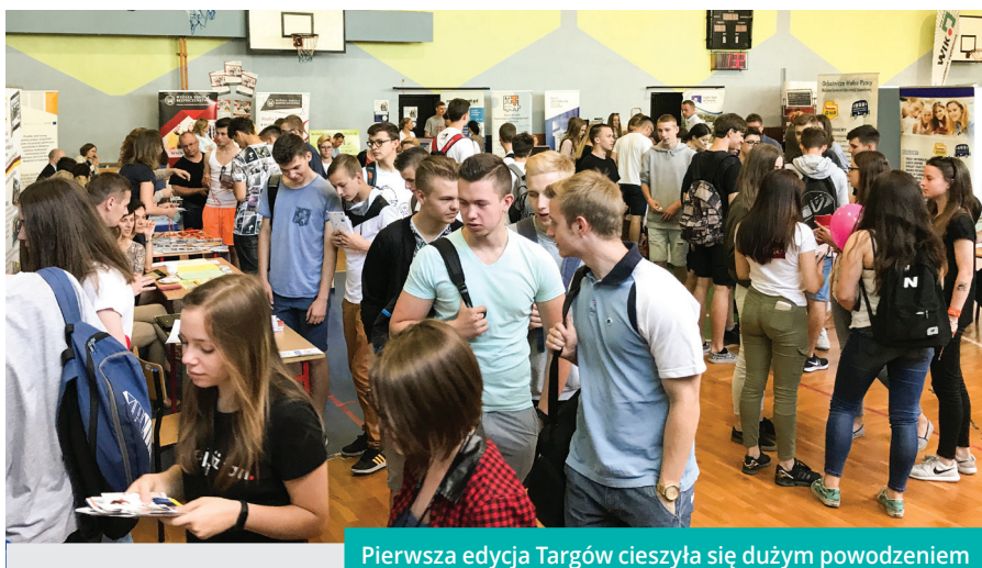
Pierwsza edycja Targów cieszyła się dużym powodzeniem