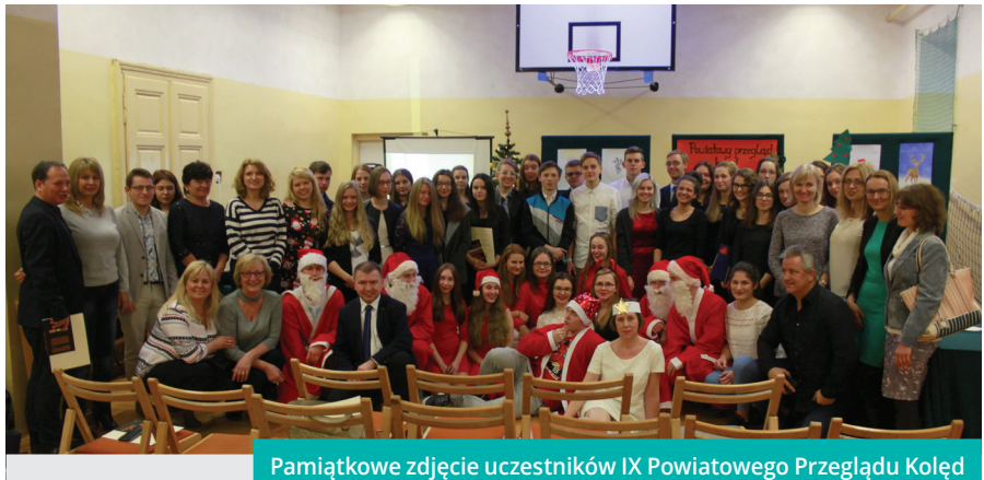
Pamiętkowe zdjęcie uczestników IX Powiatowego Przeglądu Kolęd

P odczas koncertu obecni byli również dyrektor i nauczyciele z partnerskich szkół ze Słowacji. Jak co roku, koncert był pełen niezapomnianych wrażeń muzycznych. Szkolni artyści przedstawili niezwykle umiejętności wokalne, ciekawe aranżacje oraz interesujący repertuar. Słyszeliśmy tradycyjne polskie kolędy, np. „Gdy śliczna panna”, „Gdy się Chrystus rodzi” oraz „Oj maluśki, maluśki”; popularne pieśni bożonarodzeniowe polskie, np. „Kolędę dla nieobecnych”, a także zagraniczne przeboje, np. „Mary did you know” oraz „Jingle bell rock”. Kwartet z Czech przygotował m.in. polską wersję kolędy „Cicha noc”. Słuchacze mogli docenić piękny śpiew młodzieży oraz ich wyjątkowe zdolności instrumentalne, ponieważ uczniowie grali na gitarach, skrzypcach, instrumentach dętych drewnianych, blaszanych czy perkusyjnych.