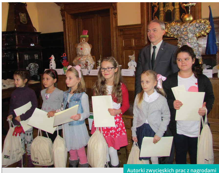
Autorki zwycięskich prac z nagrodami