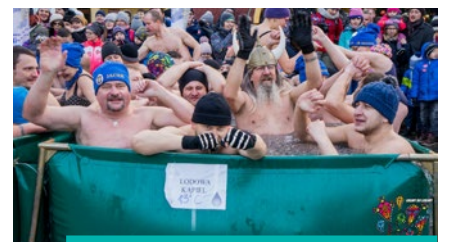
Na uczestników czeka moc atrakcji.

N ad Olzą, trasą Parkrunu, odbędzie się „Bieg i marsz NW Policz się z cukrzycą”. W hali sportowej UŚ tradycyjnie gościć będziemy turniej siatkówki amatorskiej, natomiast w sali gimnastycznej II LO im. Mikołaja Kopernika najpierw odbędzie się pokaz Krav Magi, a następnie w rozgrywkach zmierzą się pasjonaci tenisa stołowego.