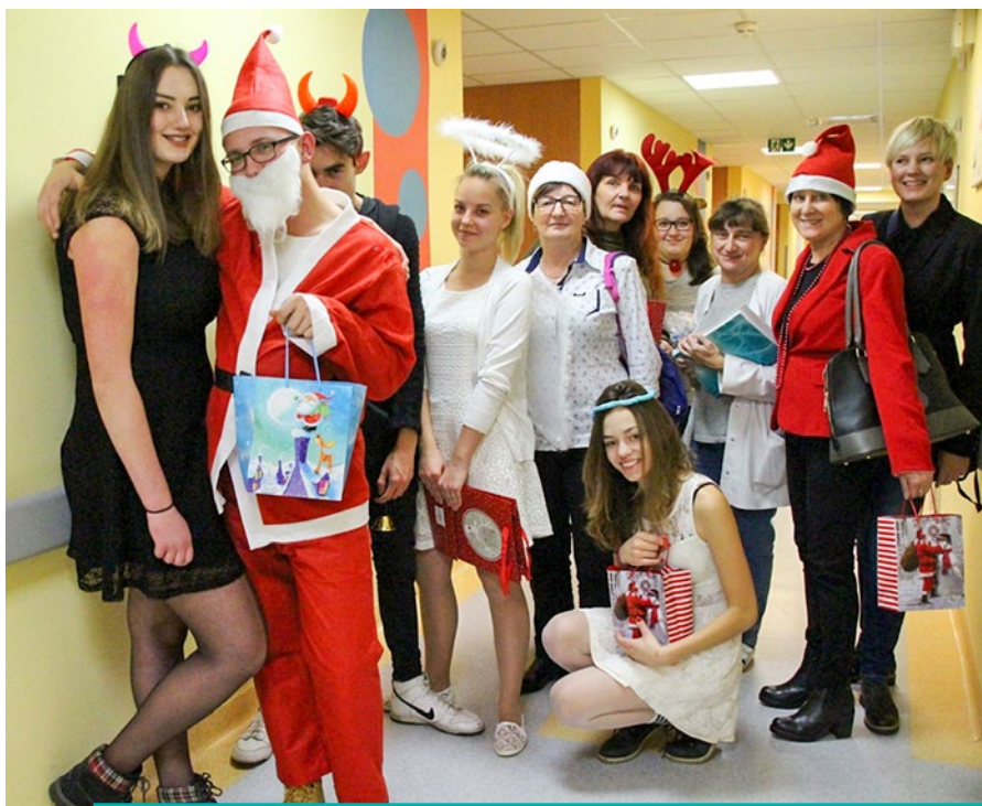
Dzięki przeprowadzonej akcji mali pacjenci choć na chwilę zapominali o chorobie.