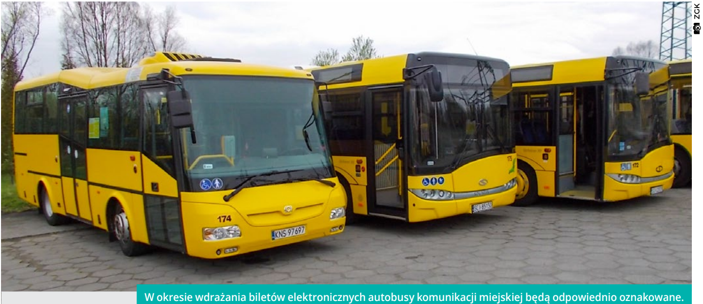
W okresie wdrażania biletów elektronicznych autobusy komunikacji miejskiej będą odpowiednio oznakowane.