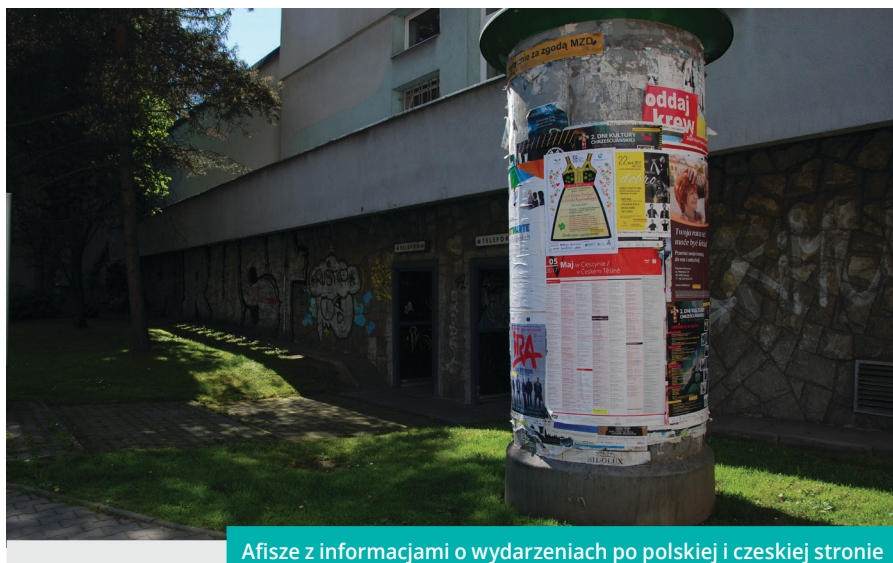
Afisze z informacjami o wydarzeniach po polskiej i czeskiej stronie