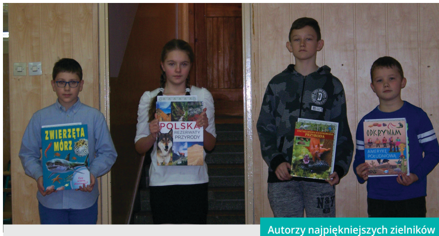
Autorzy najpiękniejszych zielników