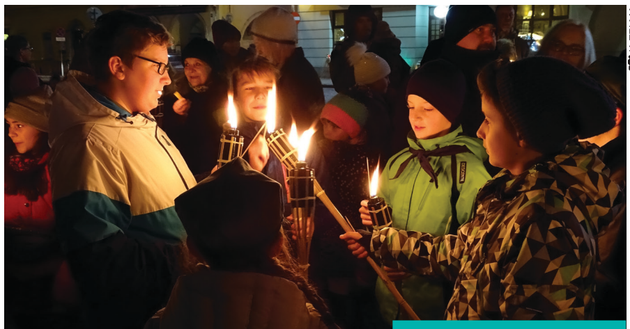
Światelko pokoju wędruje dalej