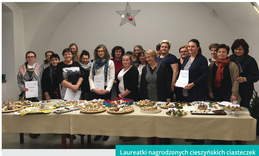
Laureatki nagrodzonych cieszyńskich ciasteczek