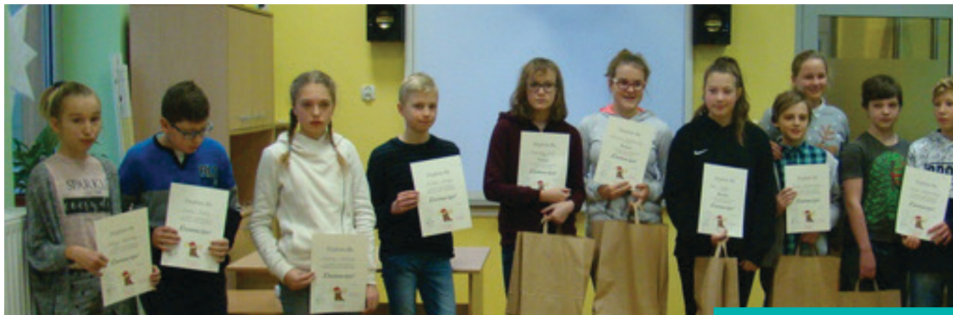
Laureaci świątecznego konkursu