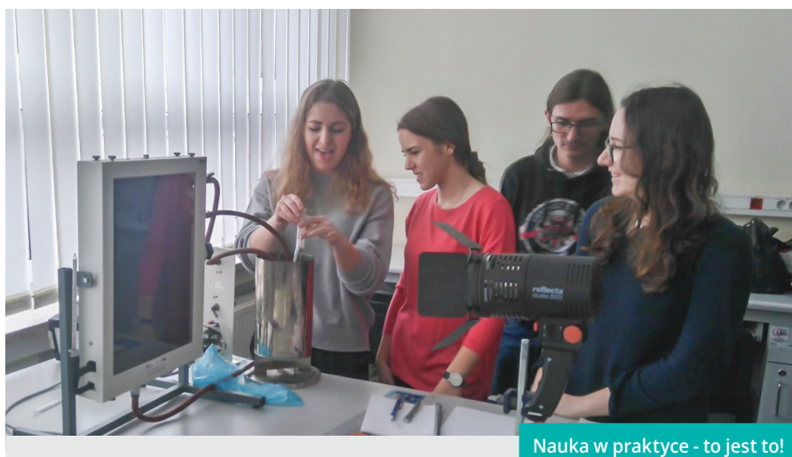
Nauka w praktyce - to jest to!

Od lat praktyką I Liceum Ogólnokształcącego im. Antoniego Osuchowskiego jest współpraca z ośrodkami uniwersyteckimi w ramach projektu tzw. Patronatów. Szkoła od lat współpracuje z wyższymi uczelniami w tym zakresie. Młodzież korzysta z wyjazdowych sesji naukowych na uczelnianych wydziałach oraz z wykładów prowadzonych w naszej szkole przez profesorów-prelegentów. Uczniowie chętnie w nich uczestniczą, mimo akademickiego poziomu i specjalistycznego języka.