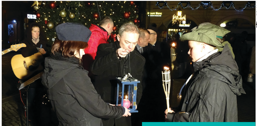
Burmistrz Cieszyna odbiera światelko