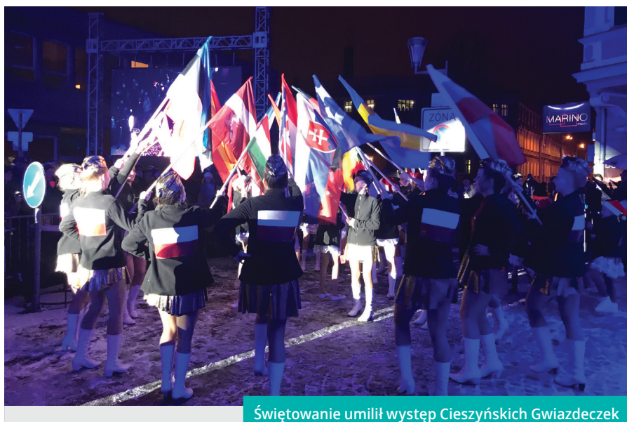
Świętowanie umilił występ Cieszyńskich Gwiazdeczek