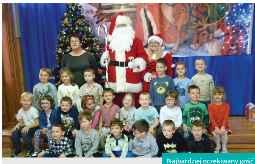
Najbardziej oczekiwany gość