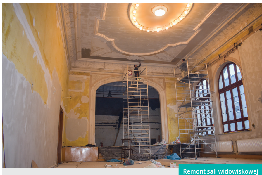
Remont sali widowiskowej

Środki finansowe na modernizację obiektu pochodzą z dwóch projektów unijnych programu Interreg V-A Republika Czeska- Polska, budżetu Gminy Cieszyn oraz z programu Ministra Kultury i Dziedzictwa Narodowego „Infrastruktura Domów Kultury”. Suma środków przeznaczonych na modernizację obiektu to ponad 2,5 mln zł. Modernizacja obiektu powinna zakończyć się do końca maja 2018 r. ♦