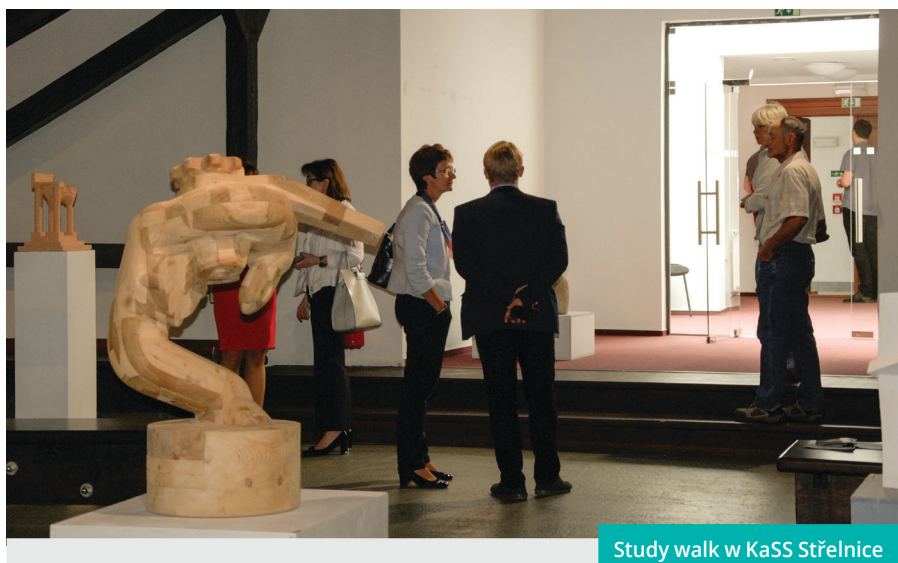
Study walk w KaSS Strělnice

Na ulicach Cieszyna i Czeskiego Cieszyna zaczęły pojawiać się na słupach i tablicach afisze zawierające informacje o wydarzeniach kulturalnych i sportowych po obu stronach Olzy. Zarówno afisze, jak i składane ulotki stały się bardzo szybko częścią pejzażu kulturalnego obu miast i głównym, kompleksowym źródłem informacji na temat życia kulturalnego i społecznego Cieszyna i Czeskiego Cieszyna. To comiesięczne, duże przedsięwzięcie, które gromadzi informacje z wielu źródeł