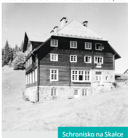
Schronisko na Skalce

We wschodniej części Śląska Cieszyńskiego działali dalej po 1920 r. „Miłośnicy Przyrody” – Touristenverein „Die Naturfreunde”, któ-