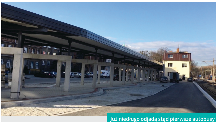
Już niedługo odjadą stąd pierwsze autobusy

Po zakończeniu robót budowlanych rozpoczną się czynności związane z wyposażeniem pomieszczeń obsługi pasażerów (nowy budynek) oraz montażem systemów informacji pasażerskiej (zarówno wizualnej, jak i głosowej). Udostępnione zostaną również pomieszczenia w zabytkowym budynku pod urządzenie, przez wybranego w drodze przetargu przedsiębiorcę, lokalu gastronomicznego. Projekt „Budowa zintegrowanego węzła przesiadkowego