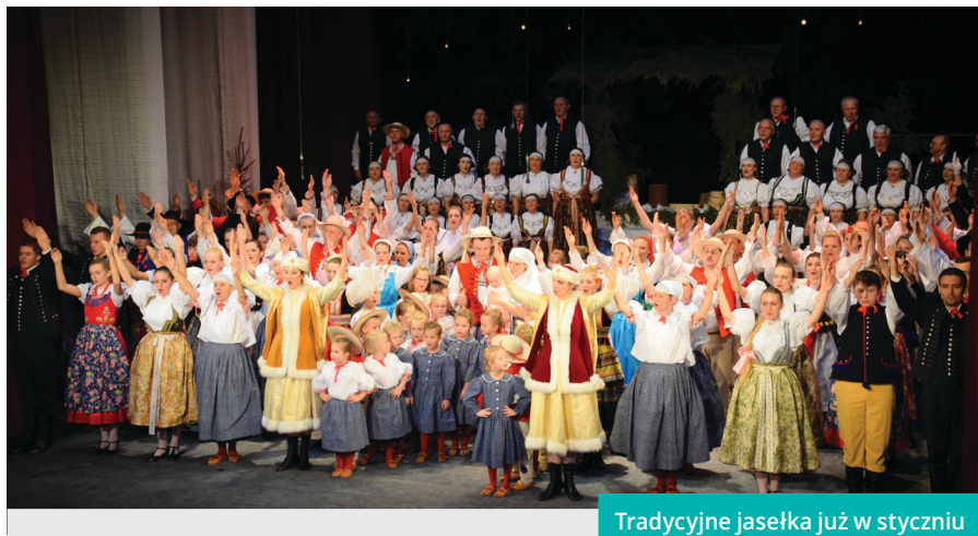
Tradycyjne jasełka już w styczniu