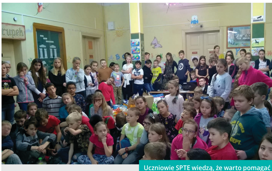
Uczniowie SPTÉ wiedzą, że warto pomagać