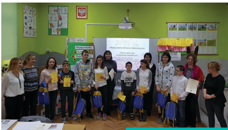
Uczestnicy konkursu matematycznego

„Piękny region nasz, na wycieczkę nadszedł czas” to temat przewodni konkursu, dlatego uczestnicy w zadaniach zostali oprowadzeni po Cieszynie i jego atrakcjach turystycznych. Uczniowie obliczali czas przejazdu autobusu, wyliczali opłaty parkingowe, podliczali rachunki, borykali się z ułamkami, szukając najkrótszej drogi i określając dokąd udała się wycieczka. Pracowali też z mapą Cieszyna wyszukując ulice prostopadłe i równoległe, mierzyli kąty obiektywu w aparacie, wyliczali koszty wycieczki z noclegiem,