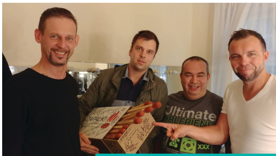
Członkowie „Ani Mru-Mru” z inicjatorem zapałczanej akcji