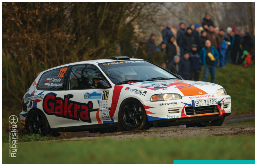
Publiczność na trasie rajdu