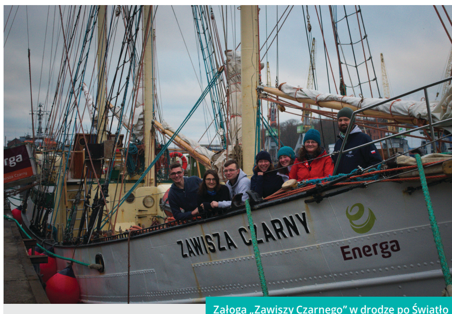
Załoga „Zawiszy Czarnego” w drodze po Światło