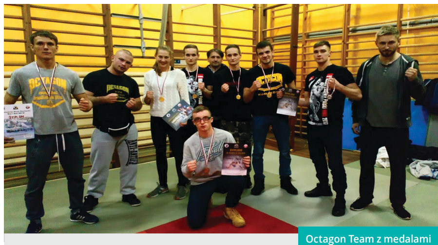
Octagon Team z medalami