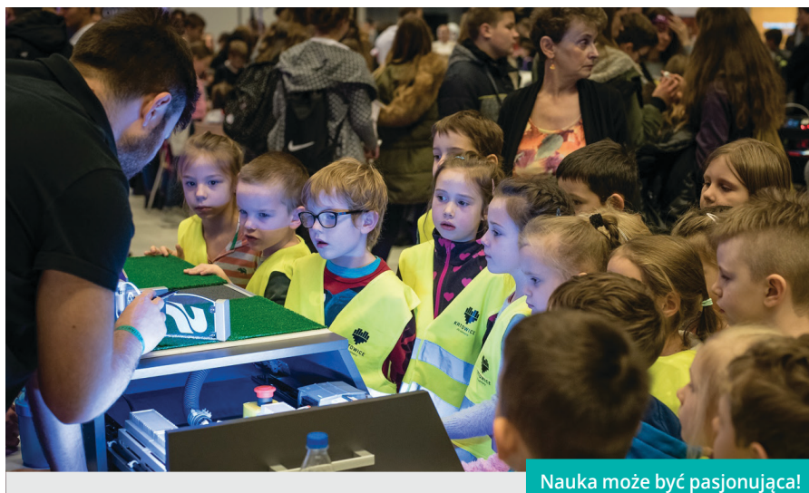
Nauka może być pasjonująca!