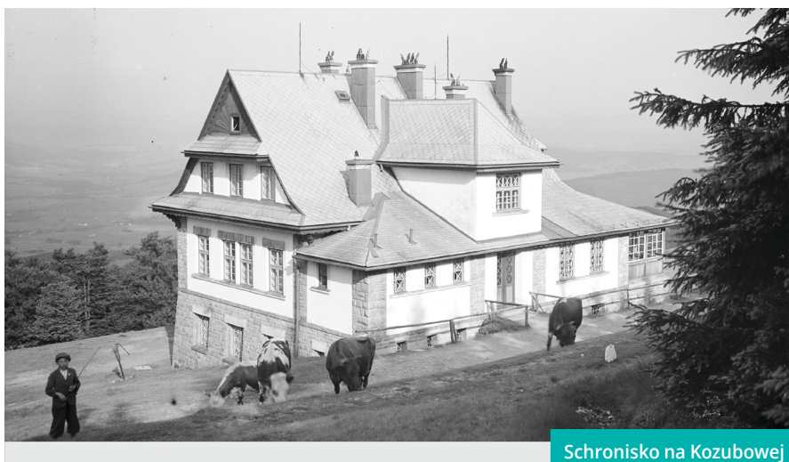
Schronisko na Kozubowej

rego sekcja ustroniska wybudowała w 1923 r. schronisko na Równicy (rozbudowane w końcu lat 20. przez górnośląski oddział Polskiego Towarzystwa Tatrzańskiego), a aleksandrowicka – schronisko na Błatniej w 1926 r. W Bielsku siedzibę miało Bielsko-Bialskie Żydowskie Stowarzyszenie Gimnastyczno-Sportowe „Makkabi”, które jednakże ulokowało swoje schronisko w 1928 r. na Hali Boraczej w Beskidzie Żywieckim.