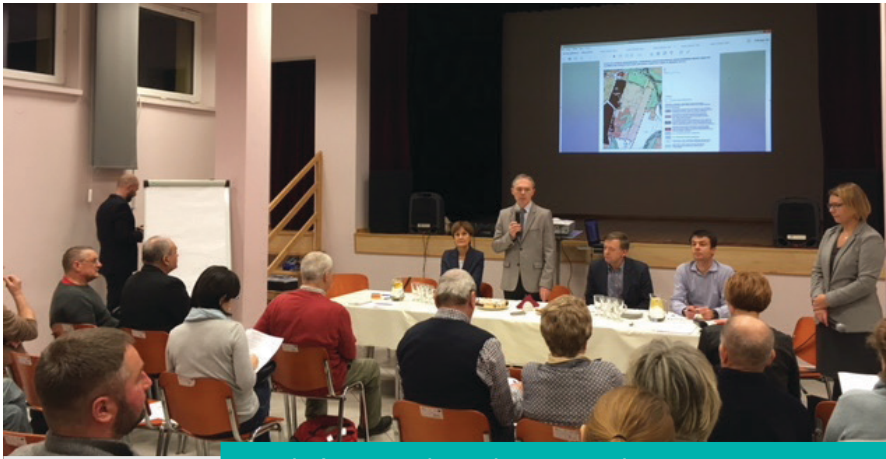
Mieszkańcy na spotkaniu dotyczącym planowania przestrzennego