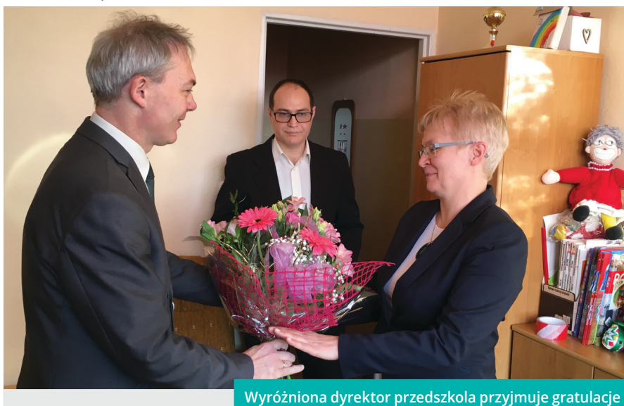
Wyróżniona dyrektor przedszkola przyjmuje gratulacje