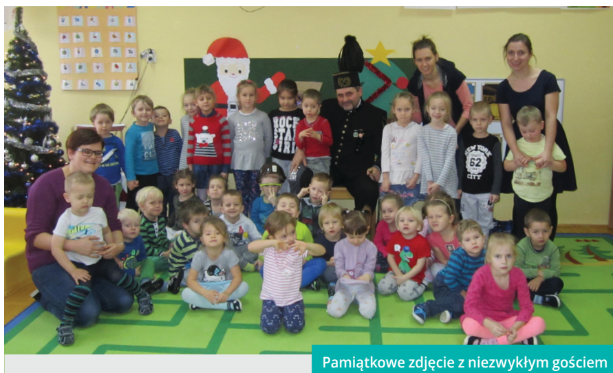
Pamiątkowe zdjęcie z niezwykłym gościem