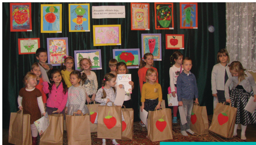
Laureaci na tle zwycięskich prac