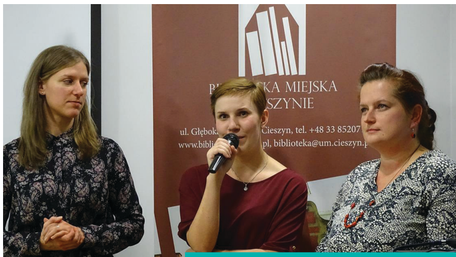
Spotkanie z wolontariuszkami w Bibliotece Miejskiej