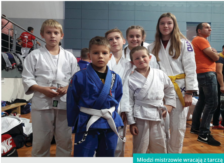
Młodzi mistrzowie wracają z tarczą