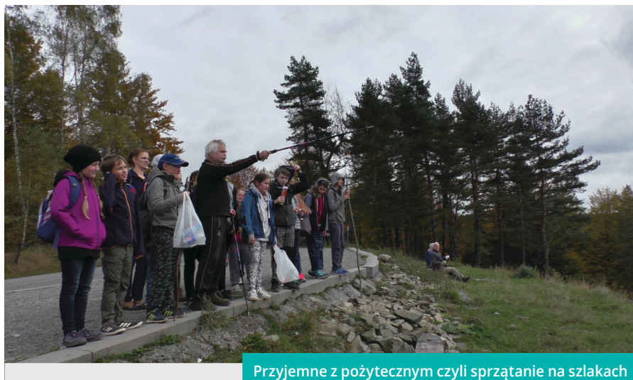
Przyjemne z pożytecznym czyli sprzątanie na szlakach