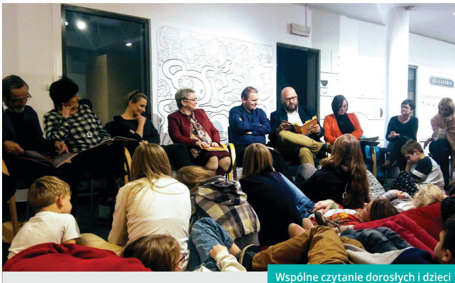
Wspólne czytanie dorosłych i dzieci

Natomiast dwie godziny później, o 17.00, zapraszamy do Zamku rodziców oraz nauczycieli. Podczas spotkania zatytułowanego „Książka obrazkowa – sło-