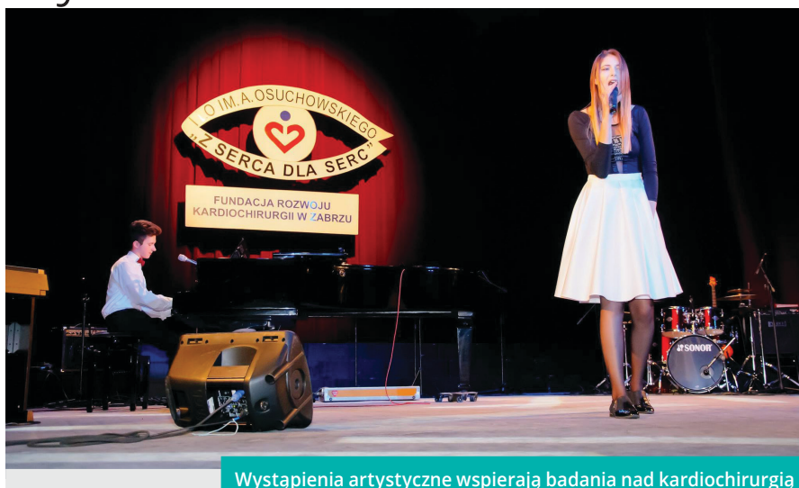
Wystąpienia artystyczne wspierają badania nad kardiologią

1 grudnia o godz. 17 odpalimy artystyczną scenę Teatru im. Adama Mickiewicza w Cieszynie. Specjalnym gościem tegorocznej edycji koncertu będzie chór akademicki „Harmonia” z Uniwersytetu Śląskiego w Cieszynie. Wszystkich, którzy chcą miło spędzić grudniowe popołudnie i włączyć się z nami w ideę pomagania zachęcamy do kupienia biletów w sekretariacie szkoły przy pl. Słowackiego 2 w cenie 20 i 15 zł (tel. 338521139).