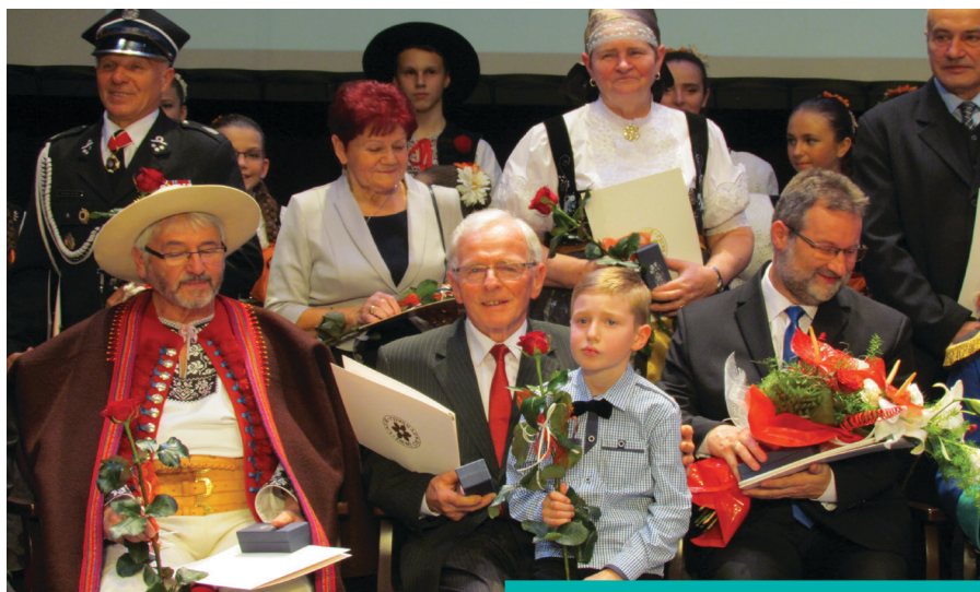
Nie brakowało wzruszających momentów