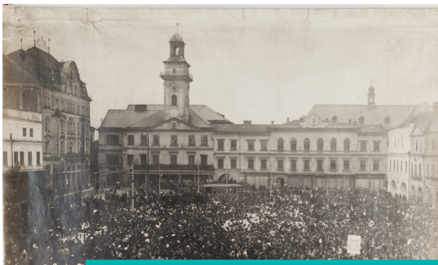
Wielki wiec za przyłączeniem Śląska Cieszyńskiego do Polski, 27.10.1918

Szanowni Państwo, zapraszam do wspólnego świętowania i proszę przekazujcie innym, że 20 października 2018 r. spotykamy się wszyscy – z Cieszyna, Jabłonkowa, Skoczowa, Orłowej i wielu innych miejscowości, aby bawić się i zrobić sobie pamiątkowe zdjęcie, które przez kolejne 100 lat będzie pokazywane następnym pokoleniom. ●