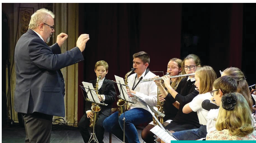
Uroczysty koncert w teatrze

Tegoroczny koncert zmodyfikował nieco formułę wydarzenia oraz wprowadził pełne nowości. Przykładem tego była prezentacja nowych instrumentów. W bieżącym roku szkolnym do oferty edukacyjnej PSM wprowadziła możliwość kształcenia się w grze na altówce i fagocie. Po latach przerwy reaktywowana została klasa waltorni. Szkoła czyni również intensywne