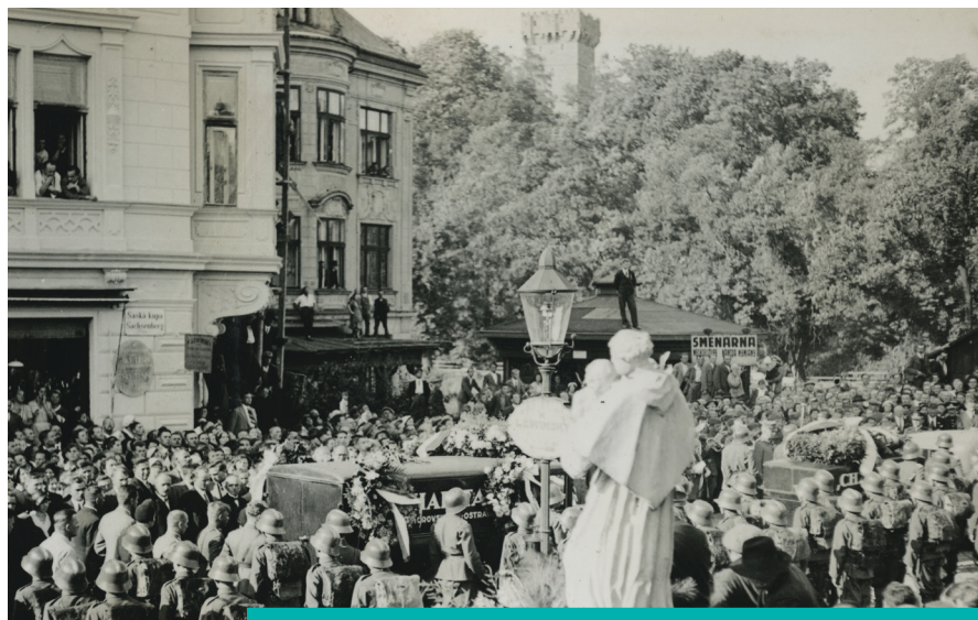
Kondukt żałobny na Saskiej Kępie w Czeskim Cieszynie, 12.09.1932

Wystawa „Śląsk Cieszyński w okresie międzywojennym” prezentowana jest w Muzeum Śląska Cieszyńskiego do 25.02.2018 r.