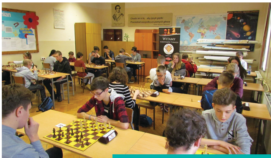
Uczestnicy I Międzszkolnego Turnieju Szachowego