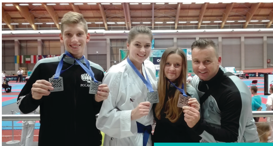
Zawodnicy Shindo znowu z medalami