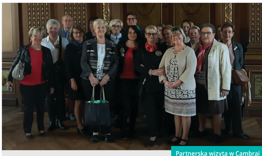
Partnerska wizyta w Cambrai

ORGANIZACJA SOROPTIMIST KLUB W CIESZYNIE