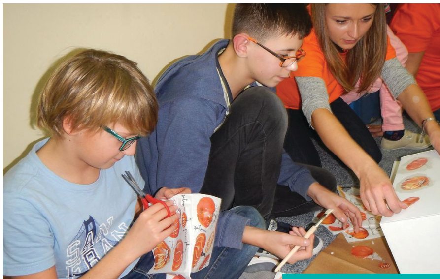
Wspólne warsztaty plastyczne

Spółeczność szkolna pragnie wyrazić wdzięczność Fundacji za wsparcie, a wolontariuszom ING za zaangażowanie i okazaną sympatię. Dziękujemy za wybór najlepszej drogi prowadzącej do drugiego człowieka – drogi serca! ♦