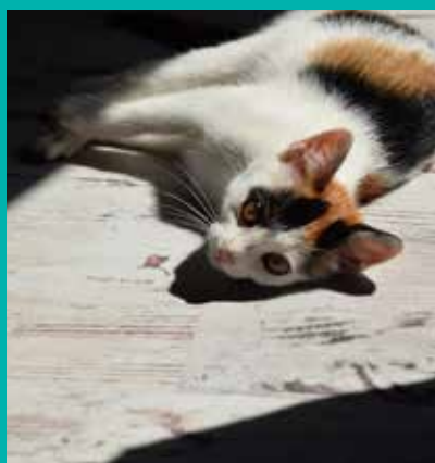
FUNDACJA „LEPSZY ŚWIAT”

Pod opieką Fundacji „Lepszy Świat” znajduje się dużo psów i kotów, które czekają na nowy, kochający dom.