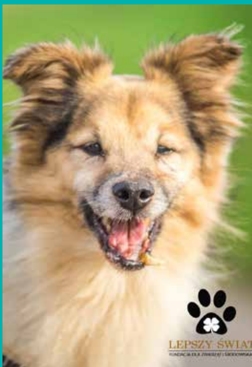
FUNDACJA „LEPSZY ŚWIAT”