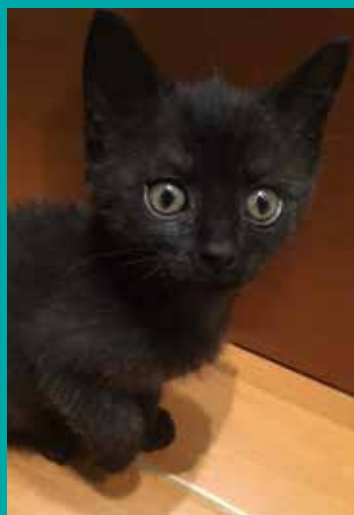
FUNDACJA „LEPSZY ŚWIAT”

Pod opieką Fundacji „Lepszy Świat” znajduje się dużo psów i kotów, które czekają na miłość człowieka, nowy, kochający dom.