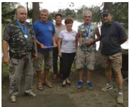
KLUB WĘDKARSTWA SPORTOWEGO OLZA

21 lipca na łowisku Gułdowy w Cieszynie odbyły się zawody w kategorii spławikowej „O Puchar Burmistrza Miasta Cieszyna”. Organizatorem imprezy sportowej realizowanej już od wielu lat był Klub Wędkarstwa Sportowego OLZA.