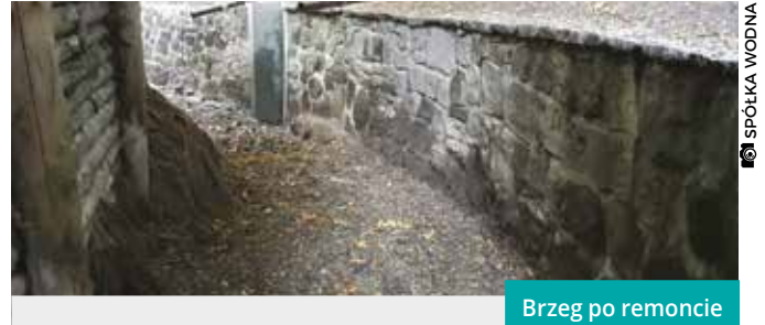
Brzeg po remoncie

Od końca lutego do połowy kwietnia przeprowadzono generalny remont śluzy spustowej Młynówki do rzeki Olzy na Al. Piastowskiej. W ramach zadania dokonano: napraw murarskich obramowania i przepustu śluzy, napraw ślusarskich, odnowienia elementów napędowych. Całkowita wartość robót: 15.784,05 zł.