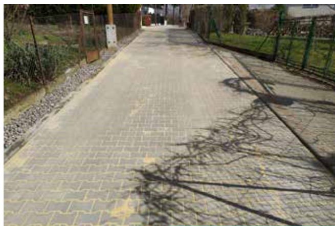
Ulica Konopnickiej po remoncie