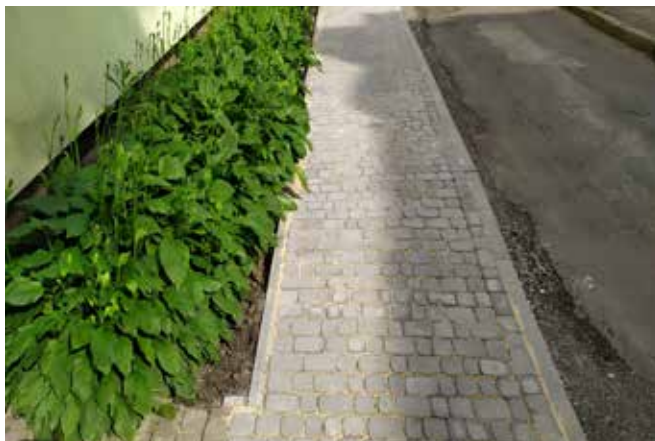
Ulica Strzelców Podhalańskich w trakcie remontu