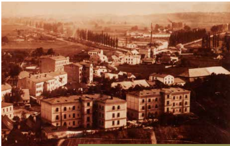
Lewobrzeżna część miasta