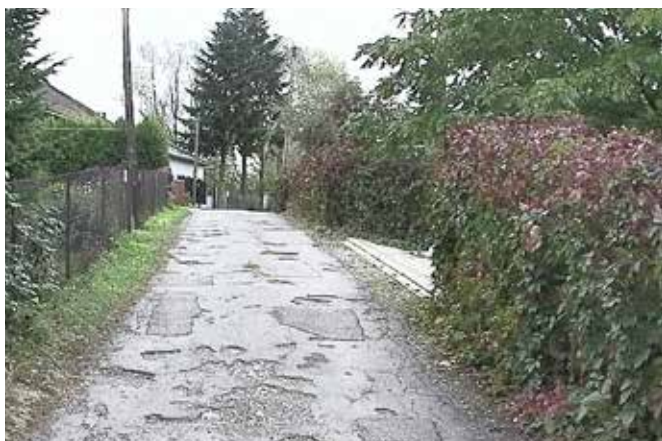
Ulica Konopnickiej przed remontem

W tym numerze prezentujemy Państwu część robót drogowych zrealizowanych w pierwszym półroczu 2020 roku przez Miejski Zarząd Dróg w Cieszynie.