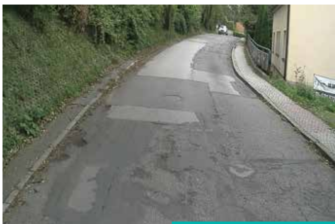
Ulica Hallera przed remontem