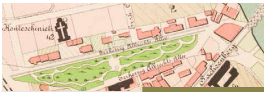
Fragment planu Cieszyna z lat 90. XIX w.

(po lewej Fragment planu Cieszyna z lat 90. XIX w.; na środku przy dolnej krawędzi na prostokątnym zarysie dawnego składu soli naniesiono czarnym kolorem rzut szkoły)