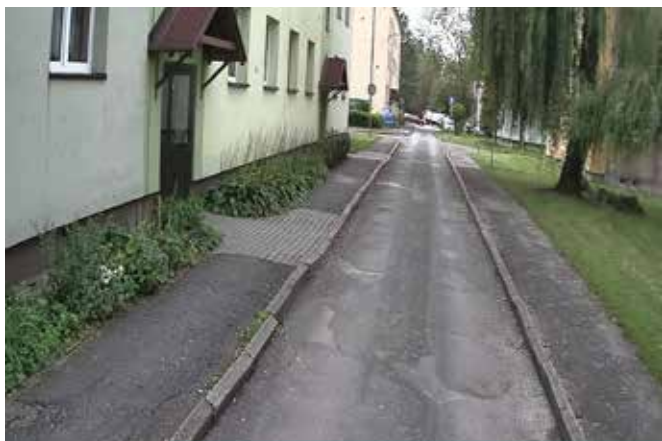
Ulica Strzelców Podhalańskich przed remontem