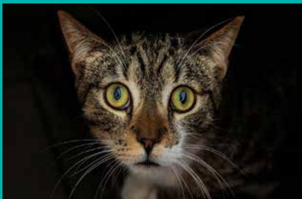
FUNDACJA „LEPSZY ŚWIAT”

Pod opieką Fundacji „Lepszy Świat” znajduje się dużo psów i kotów, które czekają na nowy, kochający dom.