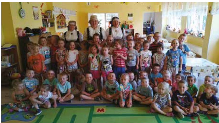
PRZEDSZKOLE NR 19