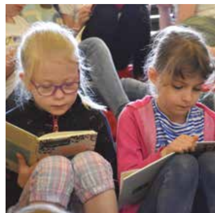
MAT. PRAS. ORG.