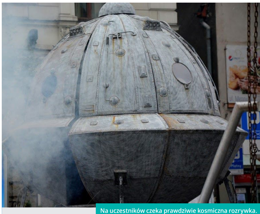
Na uczestników czeka prawdziwie kosmiczna rozrywka.

Bezpłatne bilety na Inaugurację Festiwalu można odebrać w Oddziale dla dzieci cieszyńskiej biblioteki w godzinach jej otwarcia, natomiast na spotkania autorskie, ze względu na ograniczoną liczbę miejsc, obowiązują zapisy pod nr tel. 33 8520710 w. 15 lub 16.