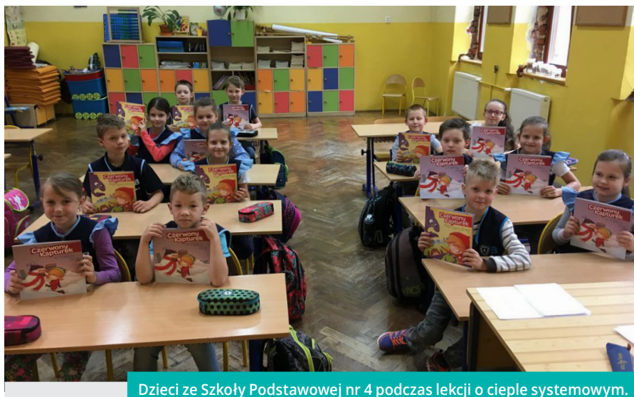
Dzieci ze Szkoły Podstawowej nr 4 podczas lekcji o ciepłe systemowym.

W październiku 2017 roku przekazano do 10 cieszyńskich szkół podstawowych 350 książeczek pt. „Czerwony Kapturek w mieście zimą”, 250 książeczek pt. „Czerwony Kapturek w mieście - misja Czarny Smog” i 20 segregatorów ze scenariuszami lekcyjnymi dla nauczycieli na temat ekologicznych sposobów ogrzewania i ochrony środowiska. Materiały edukacyjne posłużyły do przeprowadzenia w szkołach lekcji z uczniami klas I i II szkół podstawowych, na których w przystępny i interesujący sposób omówione zostały zagadnienia wytwarzania i przesyłu ciepła systemowego, racjonalnego ogrzewania pomieszczeń i sposobów ograniczania zanieczyszczenia powietrza. Akcją objęto ok. 700 dzieci. Promocja ekologicznych przyniesie owoce w długofalowej perspektywie w postaci zachowań zmierzających do szerszego wykorzystania ciepła systemowego, a tym samym ograniczenia zanieczyszczenia powietrza, którym wszyscy oddychamy. Materiały zostaną