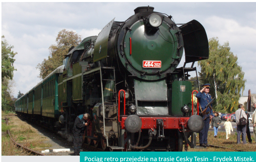
Pociąg retro przejedzie na trasie Cesky Tesin - Frydek Mistek.