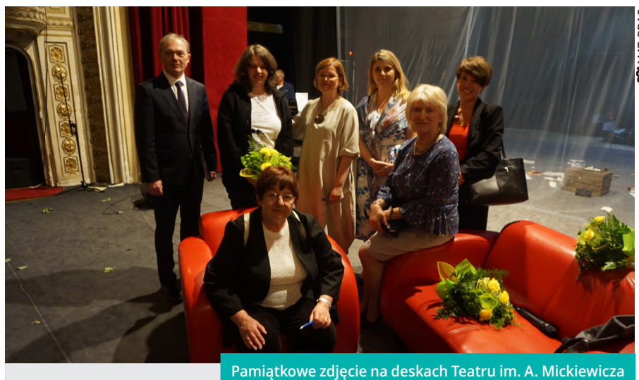
Pamiątkowe zdjęcie na deskach Teatru im. A. Mickiewicza