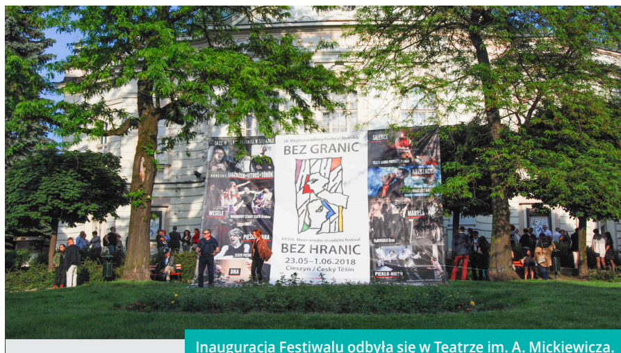
Inauguracja Festiwalu odbyła się w Teatrze im. A. Mickiewicza.

28. Międzynarodowy Festiwal Teatralny „Bez granic” – więcej informacji na temat imprezy na stronie internetowej www.borderfestival.eu