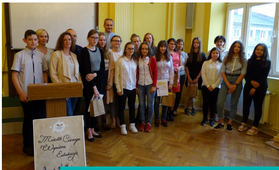
W konkursie wzięła udział młodzież szkół podstawowych i gimnazjów.