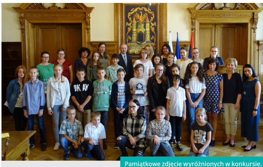
Pamiątkowe zdjęcie wyróżnionych w konkursie.