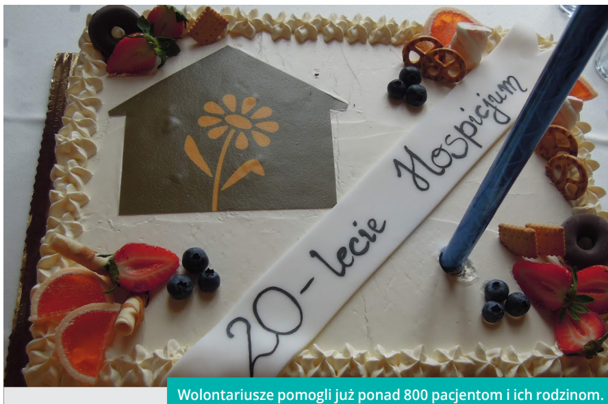
Wolontariusze pomogli już ponad 800 pacjentom i ich rodzinom.

W tym roku Hospicjum Łukasza Ewangelisty w Cieszynie świętowało swój jubileusz. To już 20 lat od kiedy służba wobec tych, którzy zostali dotknięci chorobą nowotworową, rozpoczęła w Cieszynie swoje dzieło i do dzisiaj w tak szczególny sposób prowadzona jest przez ludzi, którzy w sposób całkowicie dobrowolny, bez żadnych wynagrodzeń, ale tylko i wyłącznie z pobudek miłosierdzia chcą innym nieść pomoc.