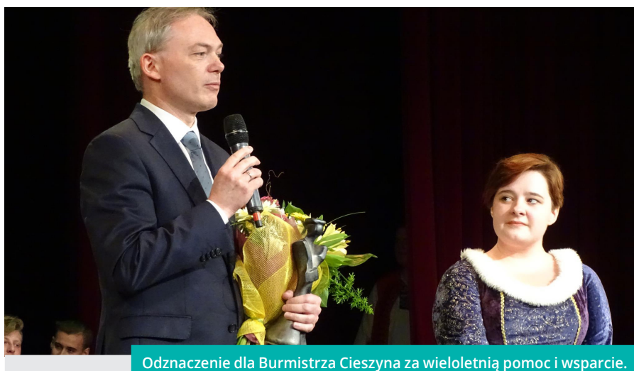
Odnaczenie dla Burmistrza Cieszyna za wieloletnią pomoc i wsparcie.