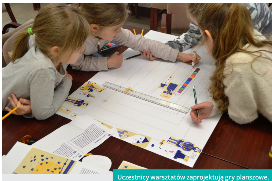
Uczestnicy warsztatów zaprojektują gry planszowe.