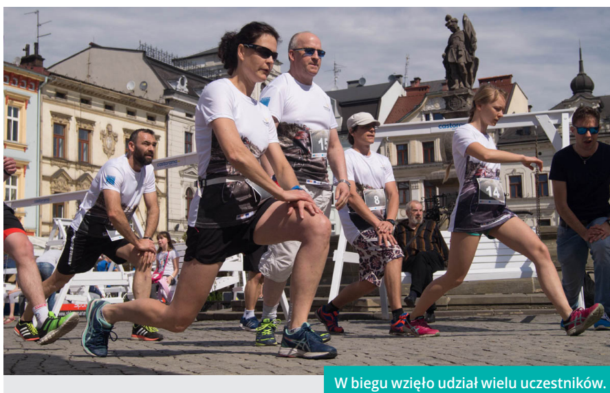
W biegu wzięło udział wielu uczestników.

Olsa Activ Race to nie tylko rywalizacja wśród biegaczy oraz rowerzystów. To także okazja do aktywnego spędzenia czasu dla całych rodzin, na które czekał szereg atrakcji przygotowanych przez organizatorów oraz sponsorów. Pokaz wozów strażackich, pierwszej pomocy czy