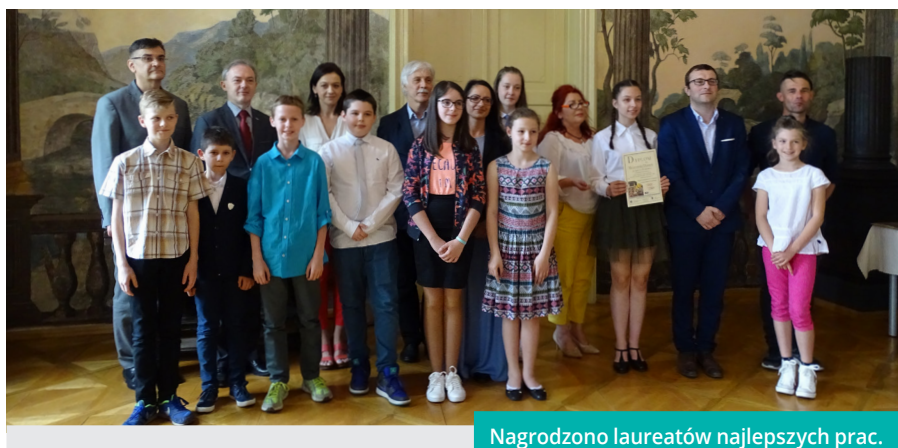
Nagrodzono laureatów najlepszych prac.

Celem konkursu było między innymi zainteresowanie uczniów lokalną historią i zwyczajami Śląska Cieszyńskiego. Organizatorzy w ten sposób postanowili również ocalić od zapomnienia dorobek, wartości i doświadczenia minionych pokoleń i wspomóc młodych ludzi w kształtowaniu umiejętności zdobywania i przedstawiania informacji. Do konkursowych zmagania zaproszeni zostali uczniowie klas IV-VII szkół