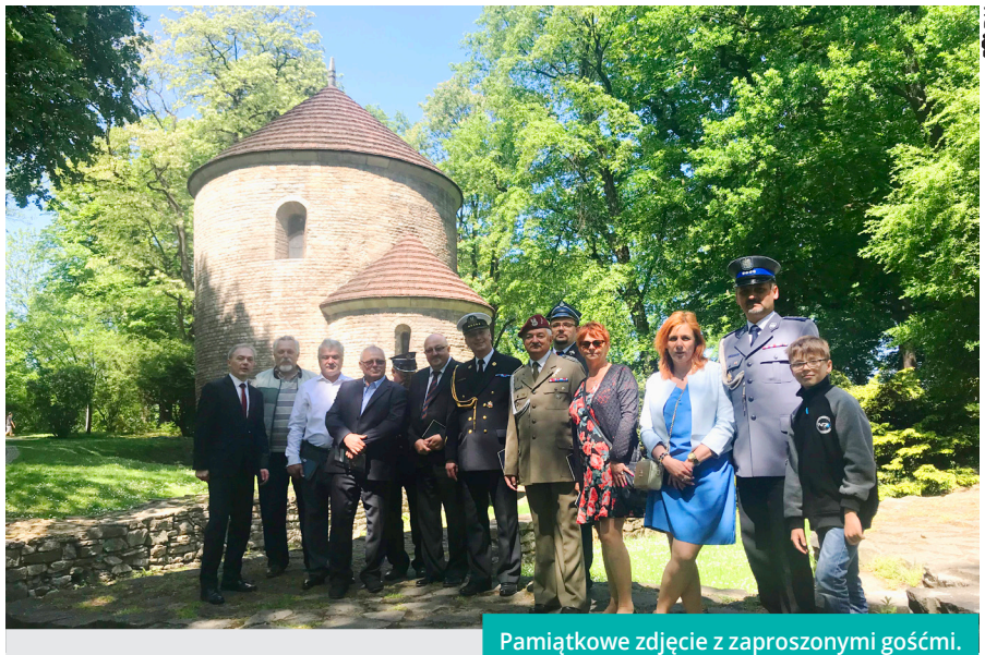
Pamiętkowe zdjęcie z zaproszonymi gośćmi.