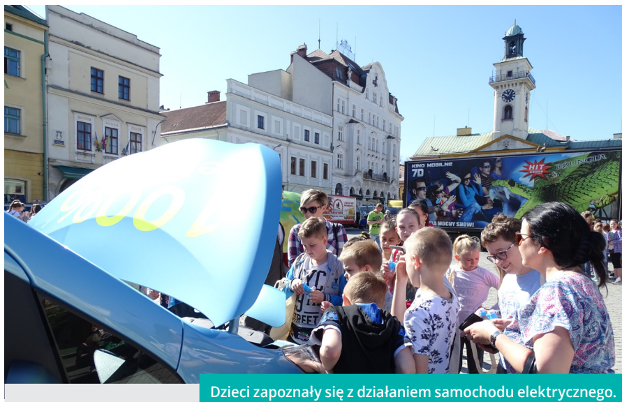
Dzieci zapoznają się z działaniem samochodu elektrycznego.