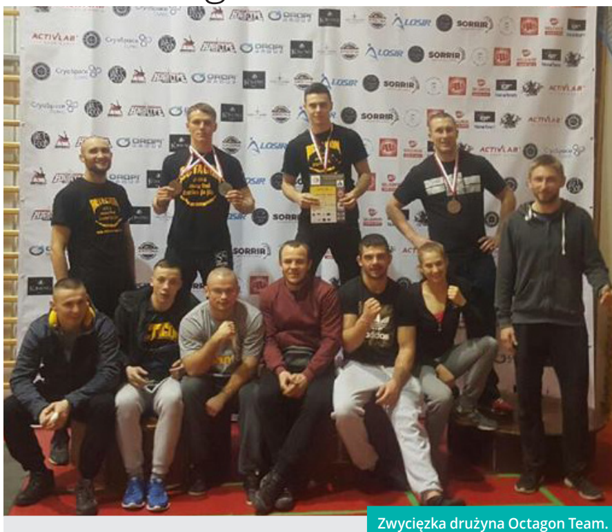
Zwycięzca drużyna Octagon Team.