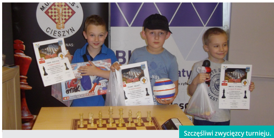
Szczęśliwi zwycięzcy turnieju.

W dniu 29 kwietnia 2018 r. w sali Spółdzielni Mieszkaniowej Cieszyńianka został rozegrany Pierwszy Szachowy Turniej z cyklu "Grand Prix Cieszyna Juniorów do 8, 10 i 14 lat". To już V edycja szachowych juniorskich zmagania w Cieszynie.