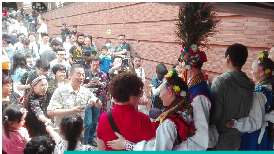
Stroje folklorystyczne budziły wielkie zainteresowanie miejscowych.

P o długiej podróży dotarliśmy na lotnisko, gdzie przeżyliśmy pierwszy szok – w Pekinie po bagaże jeździ się koleją. Sam ten fakt zapowiadał spotkanie z czymś ogromnym. I tak było. Zarówno Pekin (ponad 20 mln.) jak i pobliski Tianjin (11 mln.), cel naszej podróży, to wielkie aglomeracje najeżone potężnymi wieżowcami, z niezliczoną ilością czteropasmowych, zakorkowanych arterii komunikacyjnych i wiecznym smogiem. Dwudniowy pobyt w stolicy pozwolił nam zaledwie otrzeć się o najważniejsze zabytki: Chiński Mur, Zakazane Miasto i Plac Tian'an Men oraz zmierzyć się z absolutnie odmienną kulturą jedzenia. Pałeczki zamiast normalnych sztućców – to było nowe wyzwanie dla wielu z nas. Większą część czasu przeznaczoną na „turystykę” spędziliśmy w autokarze, poruszając się z wielkim mozołem po zatłoczonych ulicach, w smogu i hałasie klaksonów. Do Tianjin dojechaliśmy trzeciego dnia szybką koleją – 250 km w 40 min. z prędkością dochodzącą do 300 km/godz. Dodać jeszcze trzeba, że na ogromnych dworcach obowiązuje odprawa jak na lotnisku – paszporty, prześwietlanie bagaży, imienne bilety – i trzeba przewędrować z bagażami setki metrów po różnych kondygnacjach. 5th Tianjin WUDADAO Int'l Culture & Arts Festival, którego byliśmy uczestnikiem, zadbał o nas w sposób niezwykle gościnnie i iście chińska pre-