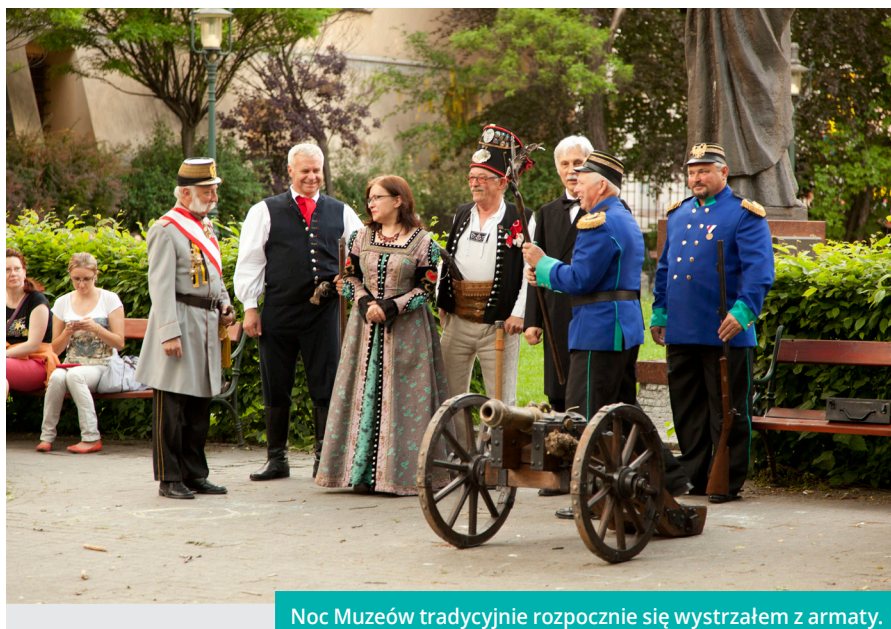
Noc Muzeów tradycyjnie rozpocznie się wystrzałem z armaty.