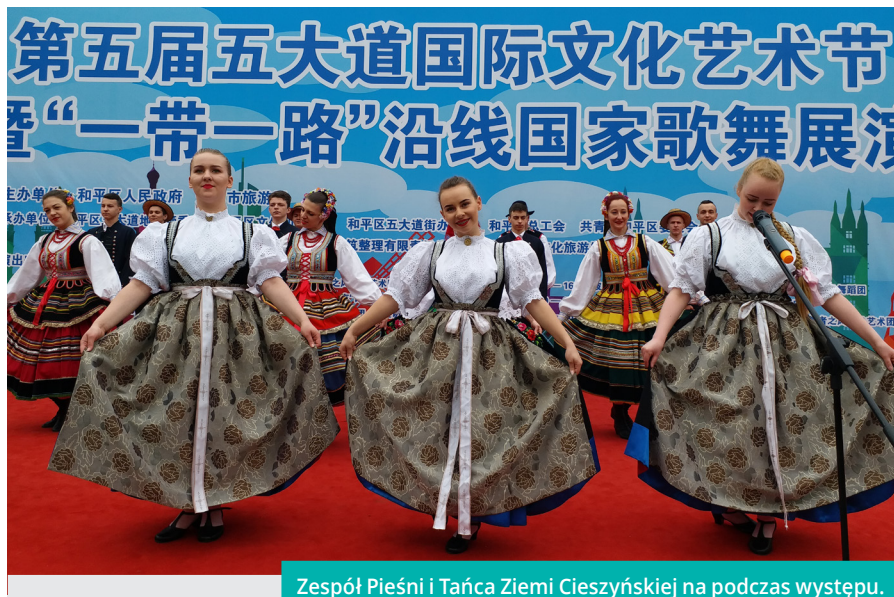
Zespół Pieśni i Tańca Ziemi Cieszyńskiej na podczas występu.