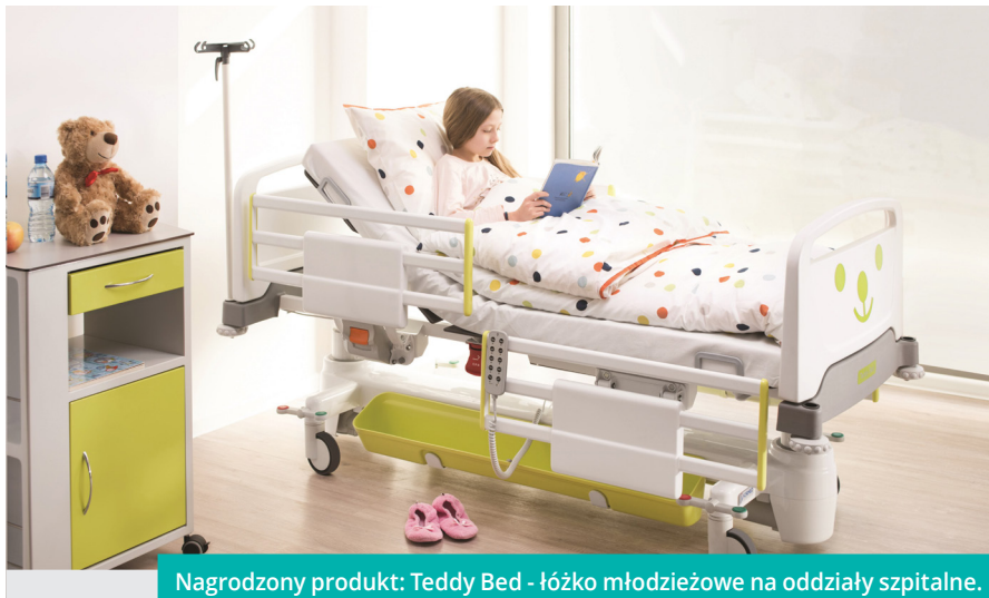
Nagrodzony produkt: Teddy Bed - łóżko młodzieżowe na oddziały szpitalne.