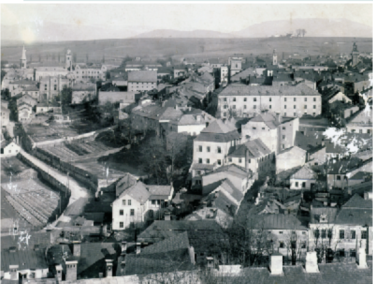
Panorama Cieszyna od strony zachodniej (ok. 1890 r.)

W 20. latach XX w. dom modlitwy przy Odboje 4 był już za mały dla członków stowarzyszenia "Schomre-Schabos", stąd też w 1928 roku wybudowali nową synagogę przy ul. Božka według planów Eduarda Davida. Synagoga "Schomre-Schabos", jedyny ocalały do dzisiaj żydowski obiekt kultowy w Cieszynie, to trzykondygnacyjny budynek z dachem siodłowym, od sąsiednich domów wyróżnia się wejściem z napisem „Szomre-Szabos” oraz pewną niezwykłością detali. Architektura synagogi była eklektyczna z elementami mauretańskimi. Pomieszczenie służące do modlitwy miało rozmiary ok. 14 na 9 metrów i wysokość 8,7 metrów, Aron Hakodesz zwrócony był w stronę południowoschodnią. Dla kobiet przeznaczona była galeria umieszczona na piętrze z trzech stron sali modlitewnej. Synagoga posiadała 152 miejsce dla mężczyzn i około setki dla kobiet. W podwyższonej suterenie znajdowało się mieszkanie dozorczy, oraz rytualna łaźnia. Synagoga "Schomre-Schabos" znajdowała się w ciągu budynków, dlatego hitlerowcy zniszczyli jej wnętrze, ale nie zdecydowali się jej spalić. Po 1945 roku była używana nadal jako dom modlitwy stowarzyszenia "Szomre-Szabos", które wznowiło działalność. Kierujący nią Natan Bergman ok. 1948 roku wyjechał do Izraela, zabierając zwoje Tory będące prywatną własnością jego rodziny. Opustoszały obiekt w 1967 roku został sprzedany Polskiemu Związkowi Kulturalno-Oświatowemu. Obecnie budynek służy PZKO dla pracy oświatowej, znajduje się tu też m.in. redakcja czasopisma "Zwrot".