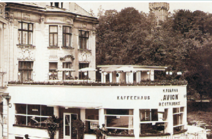
Kawiarnia Avion, widokówka z około 1935 r.

Nowy cmentarz żydowski przetrwał wojnę bez większych zniszczeń, ostatnie pochówki miały miejsce w 60. latach XX w. W 1986 roku oba cmentarze zostały wpisane przez wojewodę bielsko-bialskiego do rejestru zabytków.