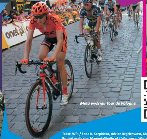
Meta wyścigu Tour de Pologne