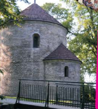
Romańska rotunda z XI w. - widniejąca na banknocie 20 zł najcenniejszy zabytek Śląska Cieszyńskiego