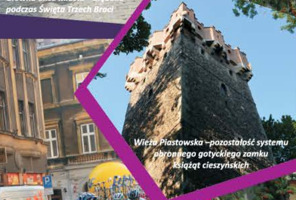
Wieża Piastowska - pozostałość systemu obronnego gotyckiego zamku książąt cieszyńskich