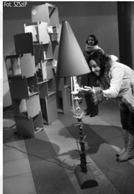
Na wystawie podziwiano lampy z pni po starych choinkach