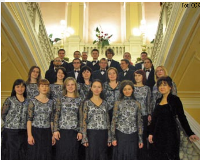
Cieszyński Chór Kameralny