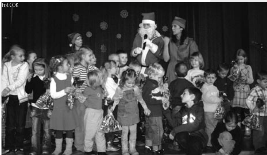
Mikołaj obdarował wszystkich słodyczkami

4 grudnia w „Domu Narodowym” dzieci odwiedził Mikołaj. Obdarował najmłodszych słodyczkami i prezentami. Dzieci obejrzały też spektakl „Na pomoc Mikołajowi”. W spotkaniu wzięły udział cieszyńskie dzieci, w tym również maluchy uczęszczające na zajęcia w pracowniach artystycznych Cieszyńskiego Ośrodka Kultury.