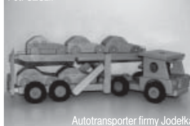
Autotransporter firmy Jodelka