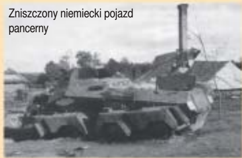
Zniszczony niemiecki pojazd pancerny

Przed południem 14 września dywizja została zaatakowana - ponownie - przez dywizję gen. Materny, które to ataki żołnierze gen. Kustronia zdolali odeprzeć. Według otrzymanych tego samego dnia rozkazów, w dniu następnym, tj. 15 września, 21 Dywizja ruszając z Cewkowa miała uchwycić i utrzymać węzeł drogowy Oleszyce – Lubaczów, a maszerująca z Aleksandrowa, na równej wysokości, na lewym skrzydle 6 DP gen. Monda – Cieszanów. 21 Dywizja podjęła marsz już nocą z 14 na 15 września, ale 6 DP ruszyła dopiero rano. Opóźnienie dywizji gen. Monda miało mieć dla żołnierzy gen. Kustronia skutki tragiczne – pomiędzy oboma dywizjami zaczęła powstawać, szybko powiększająca się, luka.