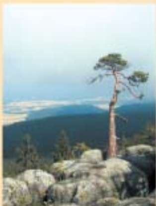
Przyroda Gór Stołowych

Dariusz Pszczołka (dok. w następnym numerze WR)