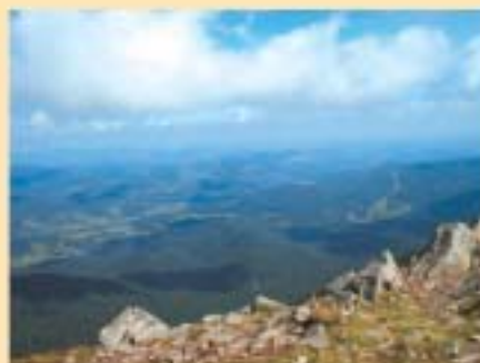
Widok z Babiej Góry

Dziesiątego dnia wyprawy zmierzyłem się z Matką Niepogody, Królową Beskidów, drugim co do wysokości szczytem wchodzącym w skład Korony Gór Polski – Babią Górą (1725 m) leżącą w Beskidzie Żywieckim. Swoją wędrówkę rozpocząłem czerwonym szlakiem z przełęczy Krowiarki. Podejście do Sokolicy prowadzi przez charakterystyczny las, który przypomina mi nieco prehistoryczne lasy. Ścieżka momentami dosyć mnie męczyła – 50 cm stopnie robiły swoje. Co ciekawe, niekorzystnie oddziaływało to na moją psychikę i wmawiałem sobie, że nie lubię chodzić po takich stopniach (przemęczone kolana). W pobliżu Sokolicy znajduje się wspaniały taras widokowy, na którym to znalazłem się o 8:50. Radość dla duszy. Znowu czas zatrzymał się w miejscu – ciało i przyroda jako metafizyczna jedność. Od tego momentu aż do szczytu wędruje się cały czas grzbietem, w związku z tym można nasycać zmysły pięknymi krajobrazami. Tego dnia, na szczęście pogoda dopisała więc napawałem się otaczającym mnie pięknem ile tylko mogłem. O 9:45 znalazłem się na szczycie Babiej Góry. Bardzo silny wiatr. Na samym szczycie jest nieprzyjemnie, dlatego należy się schować za charakterystyczną ścianą ułożoną z kamieni. Tutaj też znajduje się przejście graniczne podobne do tego, jakie jest na Rysach. Sam szczyt był otulony chmurami. Momentami pojawiały się okna, przez które można było dostrzec piękno ukryte w dolinach. Wracałem tą samą drogą. O 12:22 znalazłem się z powrotem na przełęczy Krowiarki. Tego dnia przeszedłem 9 km.