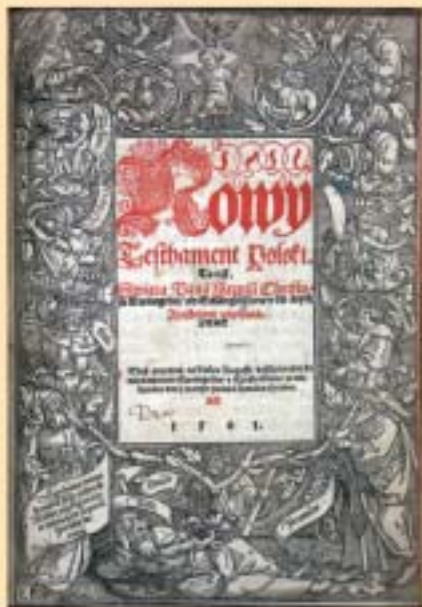
Karta tytułowa Nowego Testamentu (Biblia Leopoldy, Kraków, 1561) kopia