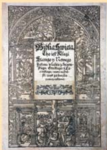
Karta tytułowa (Biblia brzeska, Brześć Litewski, 1563) kopia